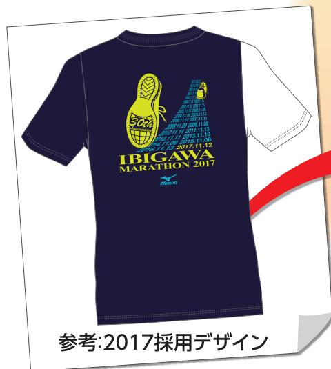
参考:2017採用デザイン

コースを駆け抜けるランナーに思いをはせながら、いびがわマラソンらしいデザインをご応募ください。